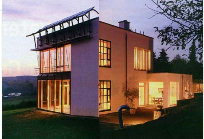
Passivhaus: Eine konventionelle Heizung ist kaum mehr nötig