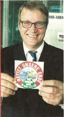
CDU-Generalsekretär Ronald Pofalla (47)

„Ich habe schon als Kind nie lange Wasser laufen lassen, passe immer auf, dass alle Stromfresser ausgeschaltet sind. In Berlin gehe ich zu Fuß einkaufen.“