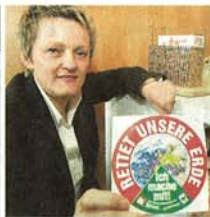
Grünen-Fraktionschefin Renate Künast (51)

Eva Herman (48), TV-Moderatorin „Ich habe mir vor vier Wochen ein Hybrid-Auto gekauft, für 50 000 Euro den Lexus R400 H. Das war ein Tipp von Klimaforscher Mojib Latif, der Gast in meiner Sendung war.“