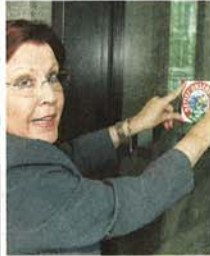
Entwicklungshilfeministerin Heidmarie Wieczorek-Zeul (64, SPD)

„Die Erde zu retten ist eine gewaltige Aufgabe – dabei kann man nicht genug Helfer haben!“