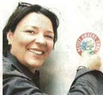
Vera Int-Veen (39), RTL 2-Moderatorin

„In meinem Haus gibt es alle Energiesparmaßnahmen, die man sich denken kann. Außerdem habe ich mir einen Brunnen bohren lassen und eine Brauchwasserzuleitung. Jeder Tropfen ist kostbar.“