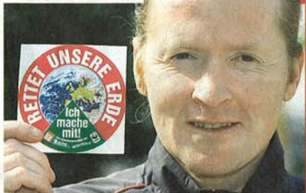
Joey Kelly (34), Sänger und Extremsportler

„Ich habe die Natur im Herzen, reite gern, fahre Kajak. Deshalb schütze ich die Umwelt, wo ich kann, und gebe dieses Bewusstsein auch an meine beiden Töchter weiter. Unser Haus wird mit modernster Umweltechnik geheizt.“