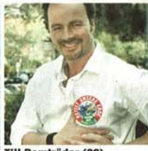
Till Demtröder (39), Schauspieler

„Ich kaufe nur noch biologisch abbaubare Wasch- oder Putzmittel. Wenn ich die Wohnung lüfte, wird die Heizung abgestellt. Außerdem kommen Bio-Abfälle auf den Komposthaufen.“