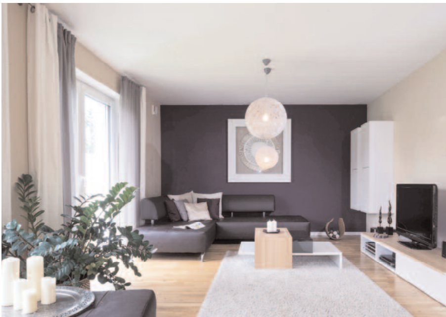
Ein Quartett aus ausgewählten Farben bestimmt die Räume und bildet den Rahmen für den modernen Einrichtungsstil.