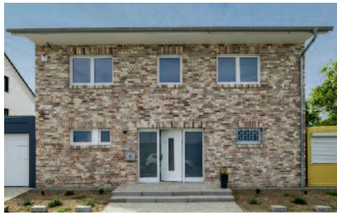
Die Klinkerfassade ist in der Region eher untypisch, hat dem Bauherrenpaar aber auf Anhieb sehr gut gefallen – genauso wie die offene Küche.

des Inneren waren Licht und viele Fensterflächen das große Thema. Der offene und in L-Form gestaltete Wohn-/Ess- und Küchenbereich ist der Wohn- und Lebensmittelpunkt der Familie. Eine Besonderheit ist, dass das Haus über drei Bäder verfügt: eines für Gäste im Erdgeschoss sowie eines für die Eltern und eines für Kinder und Gäste in der oberen Etage. Das Eltern-Schlafzimmer verfügt über eine separate Ankleide und einen direkten Zugang zum großzügigen Bad. An dieses schließt sich ein Wäscheraum mit Waschmaschine und Trockner an. Durch eine Klappe in der Wand zum angrenzenden Kinderbad kann die Wäsche von dort direkt in den Wäschekorb geworfen werden. Glücklicherweise sind Karoline und Sébastian Hervé mit der Wärmepumpe, Fußbodenheizung sowie der geregelten Be- und Entlüftung im Haus. Dies bedeutet geringe Energiekosten und hohen Wohnkomfort.