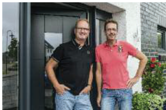
Die beiden Bauherren präsentieren voller Stolz ihr neues Zuhause.

den ausgestellten Häusern fündig. Ihr bevorzugter Entwurf „Edition 425“ musste in einigen Details an die Bauvorschriften im nordrheinwestfälischen Alsdorf angepasst werden. So wurde aus dem Satteldach eine Pult-Variante und die erforderlichen schwarzen Klinker konnten die Bauherren in eine anthrazitfarbene Variante mit weißem Putz abwandeln. „Außerdem haben wir den schon sehr großzügigen Entwurf nochmals erweitert. Dafür ließen wir den Erker um einen Meter verlängern. Dadurch