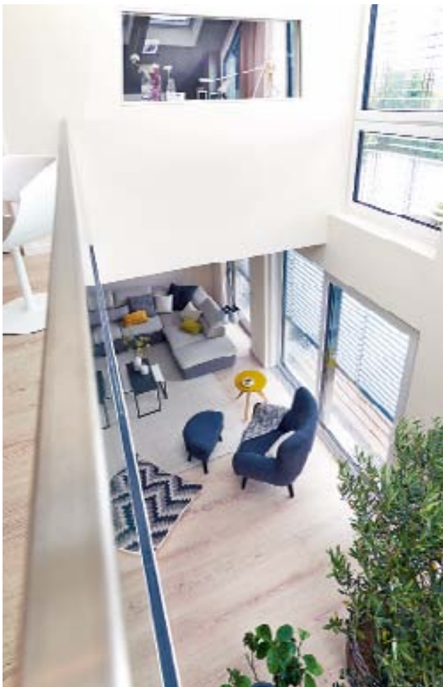
Kinderzimmer mit Aussicht: Der Raum hat ein Fenster zur offenen Wohngalerie.