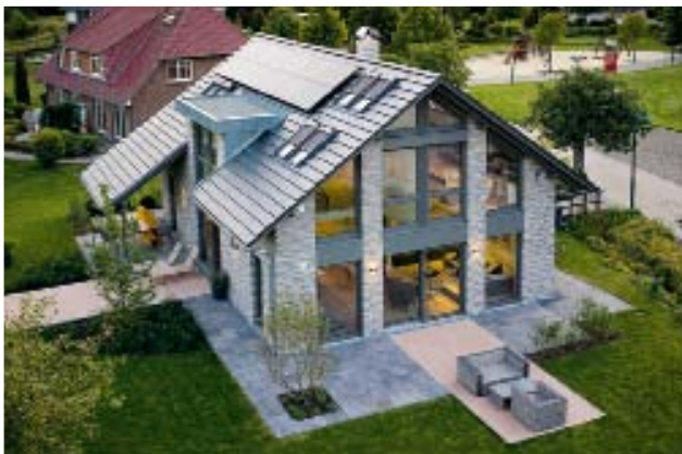
Die verglaste Giebelseite holt die Natur ins Haus.