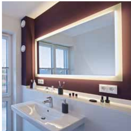
Modern und großzügig: das Bad.