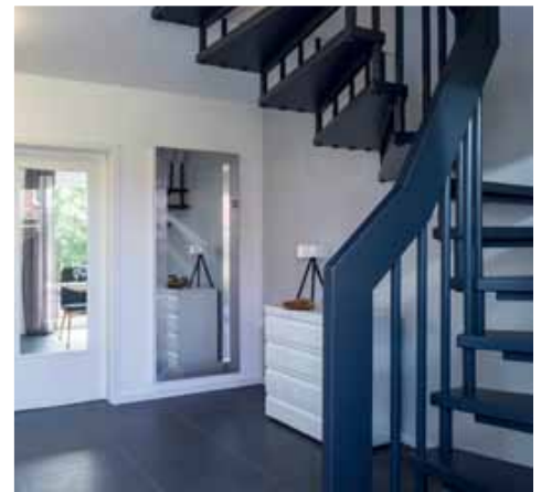
Luftige Verbindung: die Treppe im Flur.