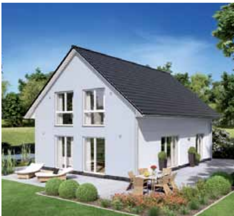
Variante mit Putzfassade.