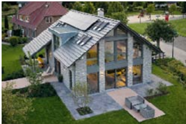
Die verglaste Giebelseite holt die Natur ins Haus.

len und sorgt natürlich auch für 440 Liter warmes Wasser und behagliche Temperaturen im Winter.