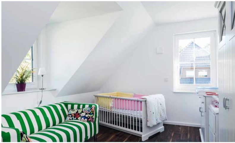
Gaube sorgen in den Kinderzimmern für mehr Raum.