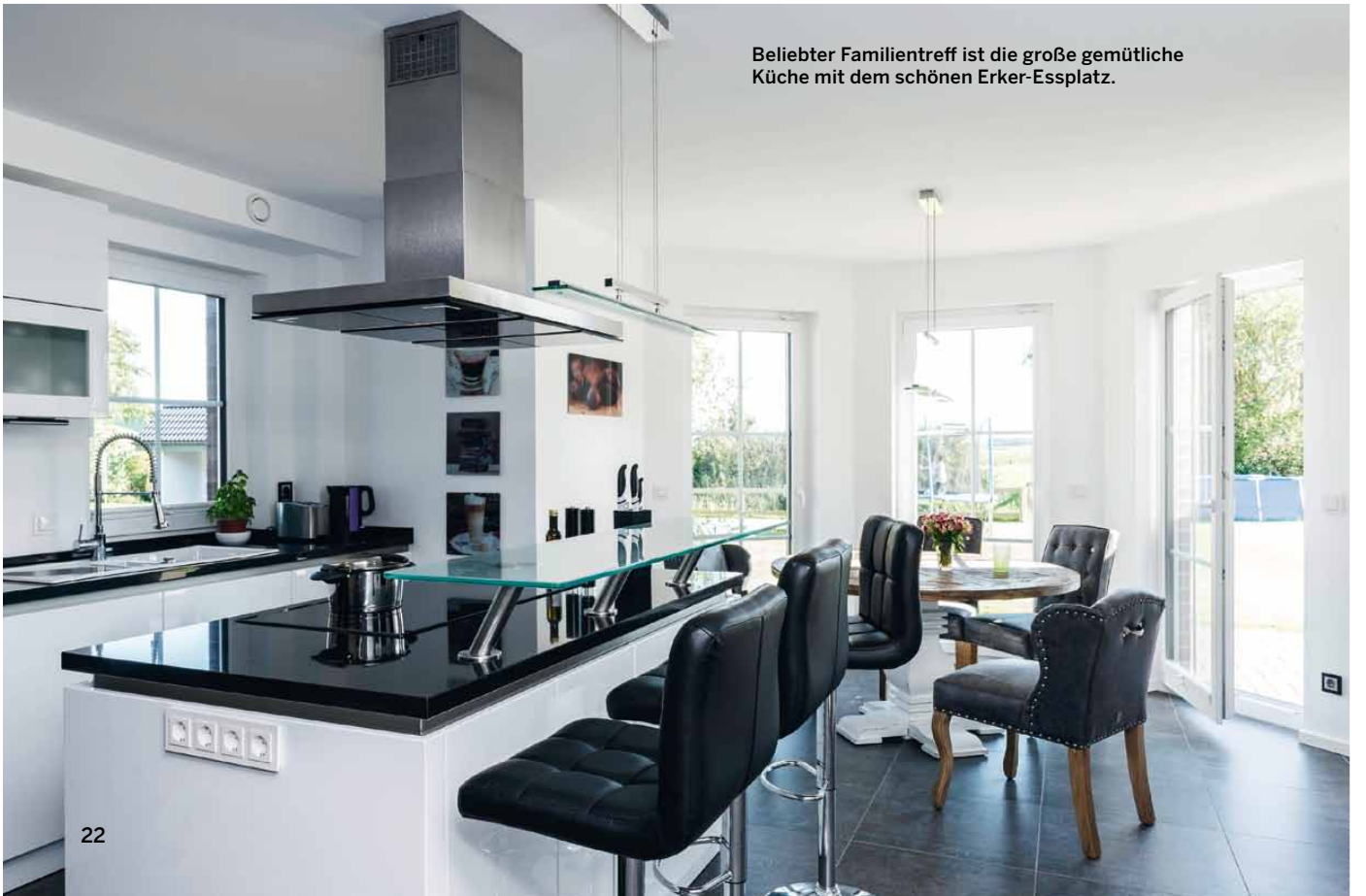
Beliebter Familientreff ist die große gemütliche Küche mit dem schönen Erker-Essplatz.