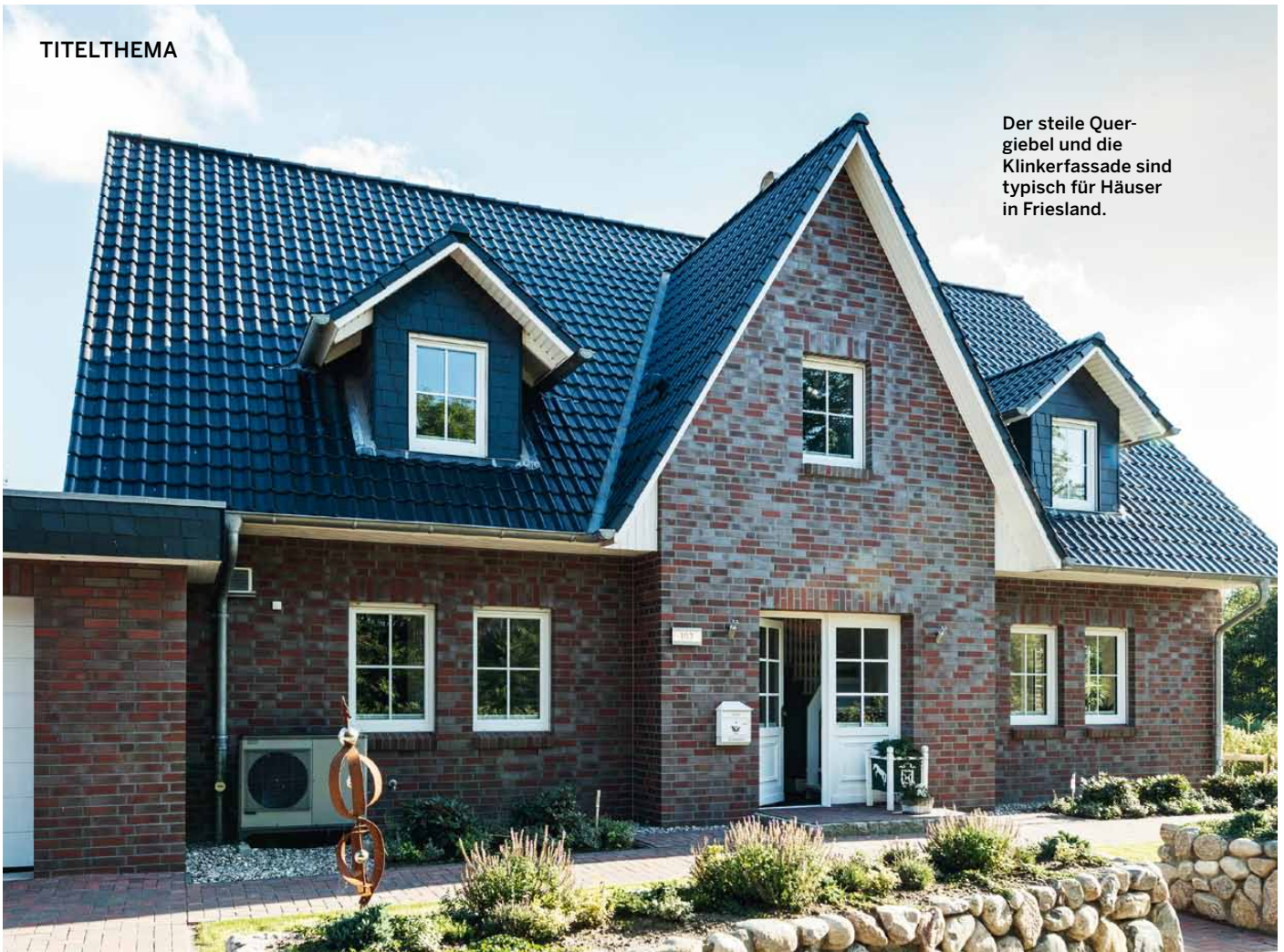
Der steile Quer- giebel und die Klinkerfassade sind typisch für Häuser in Friesland.